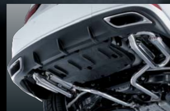
IS300h AVE30 LOOP MUFFLER 純VIP EXE type1エアロ専用 保安基準適合品 ¥120,000 (本体価格) B