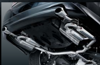
CROWN GRS210 LOOP BS-CLASS MUFFLER 純正バンパー対応 保安基準適合品 ¥160,000 (本体価格) B

純正バンパー対応 保安基準適合品 ¥150,000 (本体価格) B AERO PARTS: 純VIP EXE