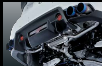
TOYOTA 86 ZN6 TITAN LOOP MUFFLER LF-SPORTエアロ専用 競技専用品 ¥150,000 (本体価格) B