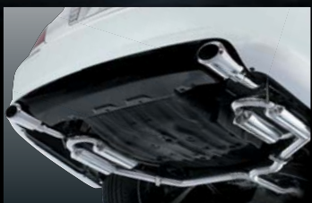
MAJESTA UZS186 LOOP BS-CLASS MUFFLER 純正バンパー対応 保安基準適合品 ¥160,000 (本体価格) B