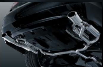
GS350 GRS191 LOOP BS-CLASS MUFFLER 純正バンパー対応 保安基準適合品 ¥160,000 (本体価格) B