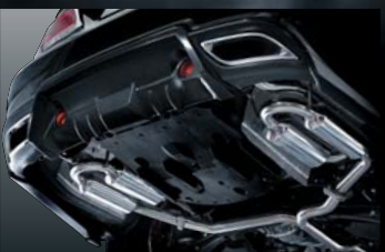
CROWN ATHLETE GRS210 LOOP MUFFLER 純VIP GTエアロ専用 保安基準適合品 ¥120,000 (本体価格) B