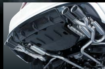
IS350/250 GSE31/GSE30 CARBON LOOP MUFFLER 純VIP EXE type2エアロ専用 保安基準適合品 ¥220,000 (本体価格) B