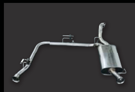
■ HYBRID MUFFLER (保安基準適合品) エアロ専用左右出しメインパイプ50φ ¥ 70,000 (本体価格) B