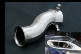
■ MUFFLER FINISHER (片側出しマフラーカッター付属) ¥ 25,000 (本体価格) C