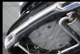
■ MUFFLER CUTTER (左右出し) ¥ 47,000 (本体価格) B