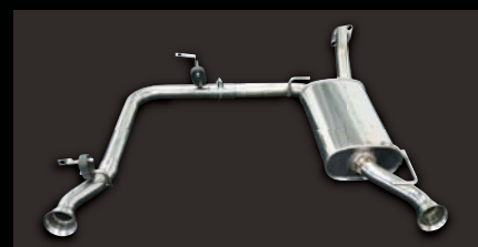
■ HYBRID MUFFLER エアロ専用左右出し (保安基準適合品) メインパイプ50φ ¥ 70,000 (本体価格) B