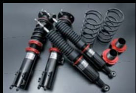
■ HYBRID DAMPER typeLS 全長調整式・ゴムブッシュベアリング内蔵アッパーマウント・減衰力2段階調整 ¥ 130,000 (本体価格) B