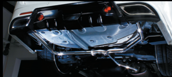
■ GTエアロ専用左右出しマフラー