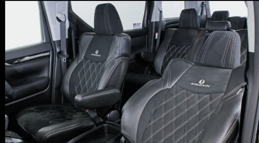
■ シートカバー GRAND LINE VersionV

ベースカラー：ブラック アクセント部：ラムースブラック ステッチ、ロゴカラー：ホホワイト 1台分 ¥120,000(本体価格)