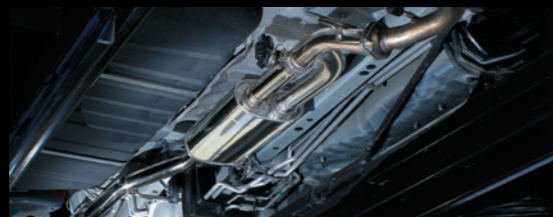
■ パワーEVS可変バルブ式センターマフラー