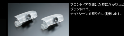
■ ロゴカーテシランプ 2PCS ¥13,000(本体価格)

フロントドアを開けた時に浮かび上がるブランドロゴ。ナイトシーンを華やかに演出します。